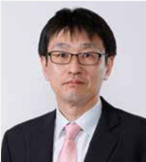
東京都立大学大学院 経営学研究科 教授 経済学プログラム (MEc) ディレクター